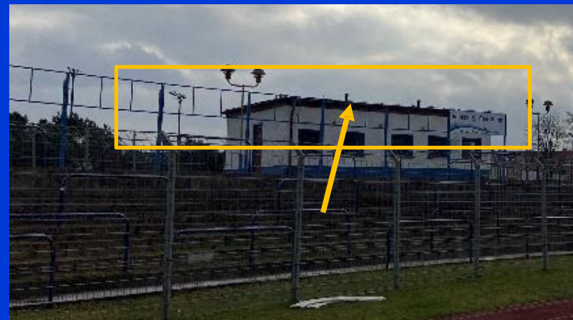
Werbefläche über der Südkurve