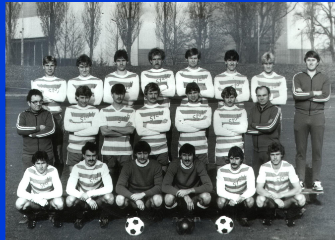
1984 AUFSTIEG IN DIE DDR-OBERLIGA