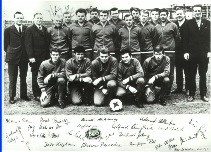
1970 BEZIRKSMEISTER, AUFSTEIGER IN DIE DDR-LIGA