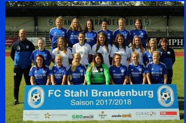
2017 & 2022 LANDESMESTER FLB 2022 LANDESPOKALSIEGER FLB