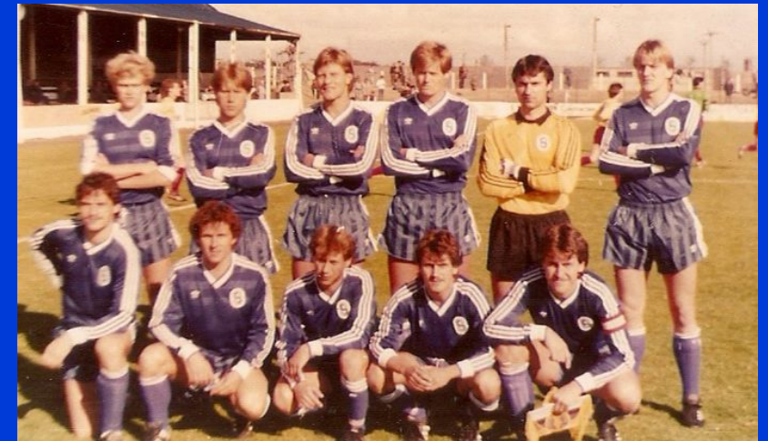
1986 UEFA-EURO-LEAGUE (FC COLERAINE UND IFK GÖTEBORG)