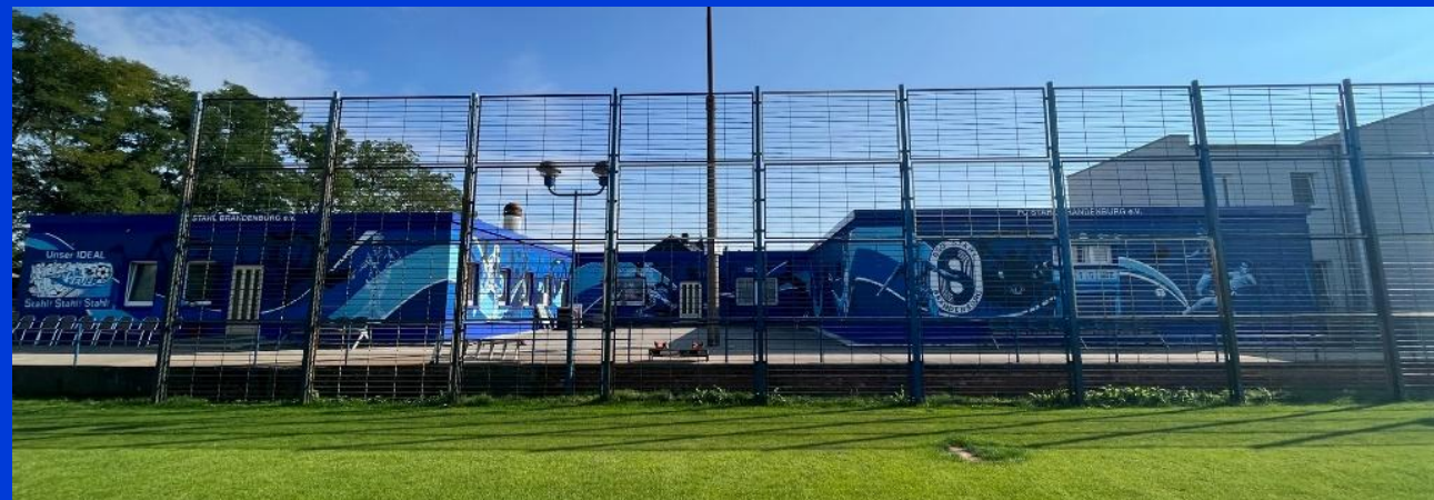
Zaun am Trainingsplatz 2 (Sozialgebäude)