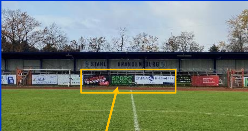
Werbebande im Stadion