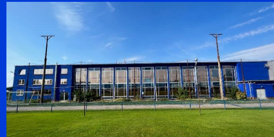
Zaun am Trainingsplatz 2 (Stahl-Palast)